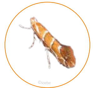
Roskastanienminiermotte ( Cameraria ohridella )