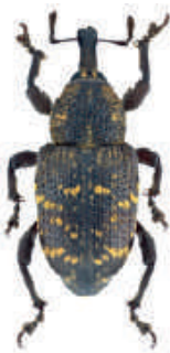
Großer Brauner Rüsselkäfer ( Hylobius abietis )