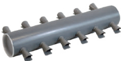
Rüsselkäfer- fangrohr ArtikelNr.: 312821