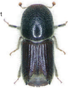
Borkenkäfer Buchdrucker und Kupferstecher

Was nicht aus dem Wald entfernt werden kann muss rasch behandelt werden. Einzelstämme können liegend, mittels tragbarer Rückenspritze vorbeugend mit 0,4 %-iger Brühe behandelt werden. Tropfnass spritzen.