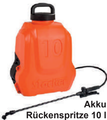
Akku Rückenspritze 10 l ArtikelNr.: 290671

Pflanzenschutzmittel vorsichtig verwenden. Vor Verwendung stets Etikett und Produktinformationen lesen. Alle Druckschriften und Webinformationen sollen beraten. Vor Gebrauch stets Etikett und Produktinformation lesen. Grundsätzlich sind die Angaben der Gebrauchsanweisung zu jedem Produkt zu beachten.