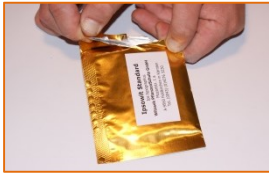
Pheromon-Typ: Standard Dispenser

Pheromone werden in einer Aluminiumverpackung geliefert. Nur der Aluminiumbeutel darf geöffnet werden. Bitte beachten Sie hierzu die Handhabung zum passenden Pheromon-Typ! Beispiele: