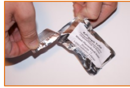
Pheromon-Typ: Tuben Dispenser