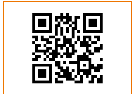
Hier geht's zum Aufbauvideo. Bitte QR-Code scannen.

Tipp: Bei dieser Variante lässt man die Enden ca. 35 cm ungeklammert und flach. So können die Fangstreifen bei Befestigung einfach überlappt werden.