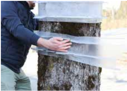
Fangstreifen am Baum anbringen ...