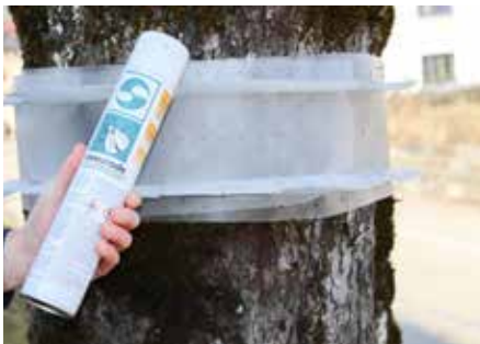
Das Beleimen erfolgt mit dem „Soveurode Spezialleim“. Die Moten bleiben kleben.