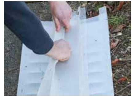
... und an der hinteren Seite ...