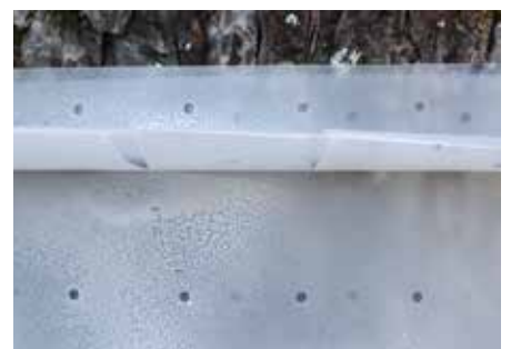
... auch auf der Ober und Unterseite der Barrieren.