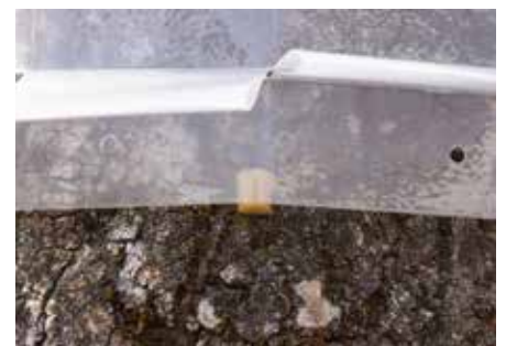
... oder zwischen Stamm und Baum klemmen. Wirkungsdauer: ca. 6 bis 8 Wochen.