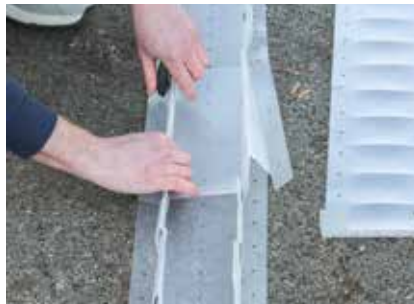
Dann beide Teile zusammenklammern.

Tipp: Bei dieser Variante lässt man die Enden ca. 35 cm ungeklammert und flach. So können die Fangstreifen bei Befestigung einfach überlappt werden.