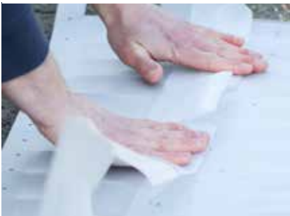
... an den vorgestanzten Falzen knicken und glattstreichen (es entstehen die Flugbarrieren).