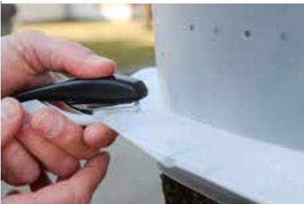
Die Lasche oben und unten mit Heftklammern fixieren.