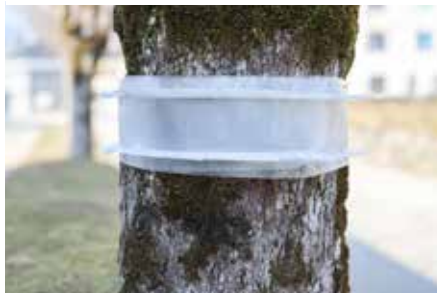
Fertig montiert. Wir empfehlen ein bis zwei Fangstreifen pro Baum je nach Befall zu verwenden.