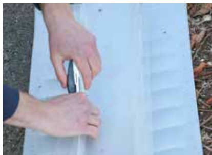
Flugbarrieren zusammenklammern. Den Vorgang an beiden Seiten durchführen.