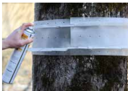
Fangstreifen gleichmäßig besprühen ...