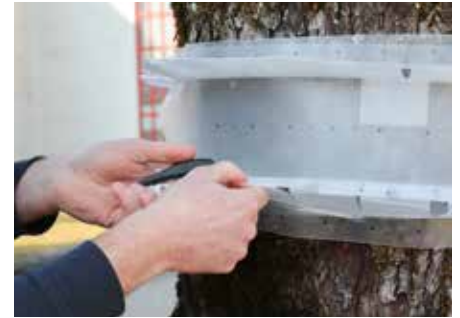
Mit der Heftklammer zusammenklammern.