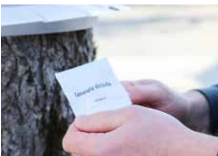
Pheromon (Lockstoff) „CamerariaWit®“ aus der Verpackung nehmen.