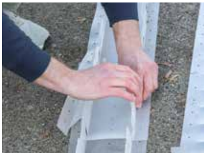
Bei einem Stammdurchmesser von größer als 35 cm, zwei Fangstreifen verwenden.