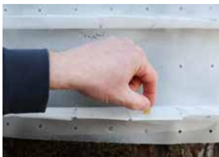
Direkt auf dem beleimten, sonnenabgewendeten Fangstreifen positionieren ...