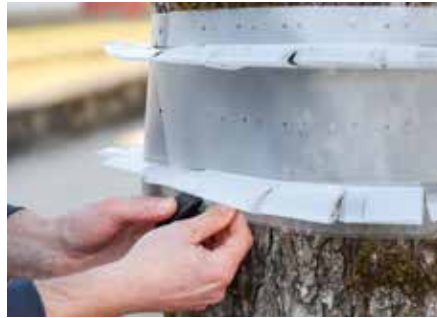
... und dabei etwas überlappen.