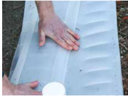
An der vorderen ...