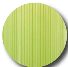
EcoTub® Plus Typ Standard

Für jeden gewünschten Durchlüftungsgrad der passende Typ bei gleichem Preis