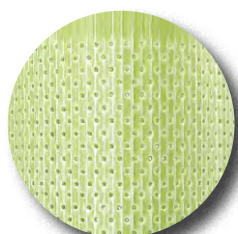
EcoTub® Plus Typ Microvent

durchgehend geschlossenes Material, besonders wachstumsfördernd