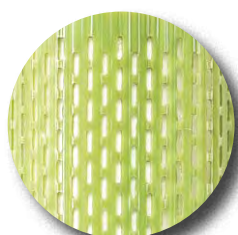
EcoTub® Plus Typ Macrovent