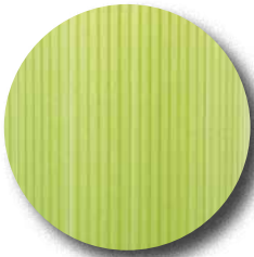
EcoTub® Plus Typ Standard

Der untere Bereich (25–30 cm) der Stammschutzsäule ist geschlossen, der obere Bereich ist mit Löchern perforiert . Die Lochung erleichtert die Transpiration der Pflanze – während tagsüber die Ansammlung der Tageshitze verhindert wird, wird die nächtliche Feuchtigkeit zurückgehalten. Ebenso erreicht der Innenraum schnell wieder die passende Temperatur und bewirkt so ein beschleunigtes Wachstum und höchste Überlebensraten Ihrer Pflanzen.